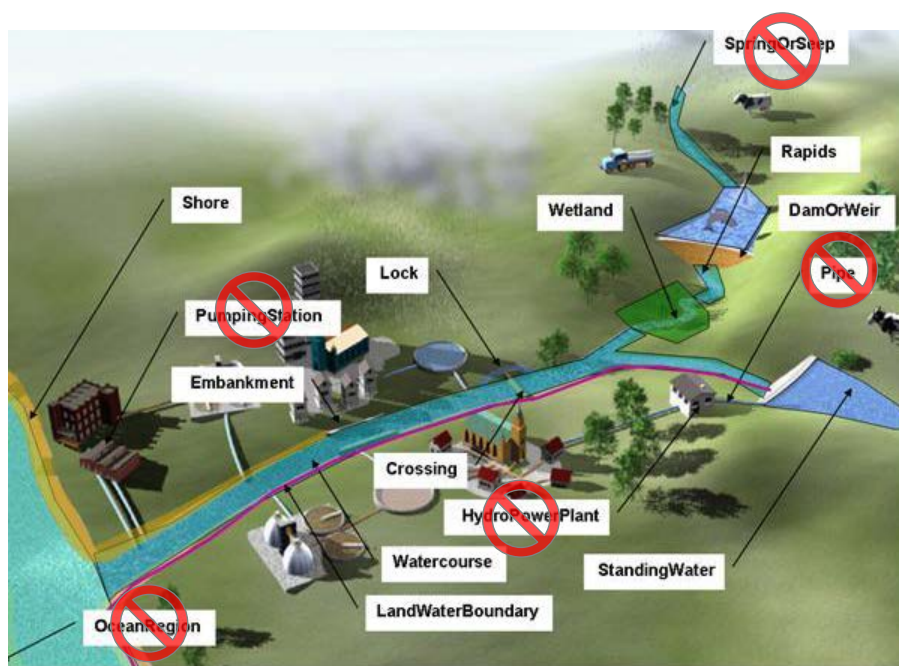
Abbildung 1. Ausgewählte Elemente der physisch vorhandenen Gewässer und verbundene Objekte

Die Datenspezifikation enthält keine speziellen Vorschriften für die geometrische Darstellung oder die Detailgenauigkeit. Im Prinzip kann daher jede vorhandene Geometrie unter Angabe der erfassten Detaillierung bereitgestellt werden. Auch gibt es keine fest vorgegebenen Grenzen hinsichtlich der Klassifizierung von Gewässern: Jedes Gewässer kann anhand einfacher, festgelegter Attribute beschrieben werden. Zusätzliche nationale Attribute können – beispielsweise zur Unterstützung der Arbeit im Mitgliedstaat – mitgeführt werden. Es gibt jedoch für das Netzwerkmodell Regeln hinsichtlich der Datenmodellierung bzw. der so genannten topologischen Beziehungen der Objekte zueinander. Diese entsprechen den Qualitätsparametern der ISO-Norm ISO 19113 .